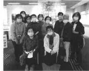
ヒストリアながとにて

まず一階では、国指定の重要文化財「有柄細形銅剣」を始め、古代石器や土器、貴重な絵巻物や萩焼など、たくさん文化財を観覧しました。続いて二階へ移動し、引き揚げ船や仙崎の様子を説明して頂き、自然コーナーでは、ドローンを使つての映像に長門の美しさを再認識しました。