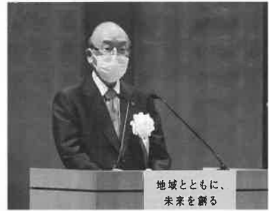
三村会頭あいさつ