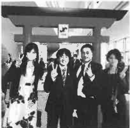
久しぶりのブロッック大会