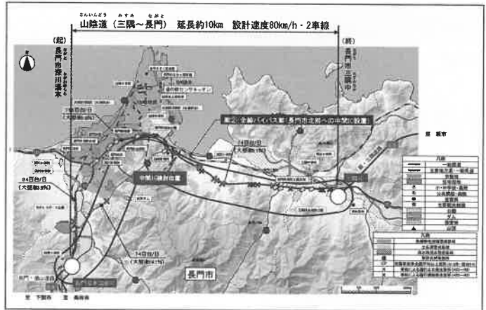
仙崎港へのアクセス道路と接続する I.C