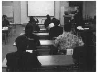
講話を熱心に聞くメンバー