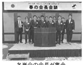
各単会の会長が集合