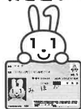
マイナンバー PR キャラクター マイナちゃん

長門市では マイナンバーカードの 出張申請受付を行っています。 お気軽にご相談下さい。