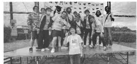
充実した時間でした

その時の方々に1年ぶりに再会出来たりと途絶えることなく関わって来て良かったな、今年度はボランティア参加を仲間と共に出来て良かったなと直