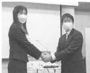
熱い握手でハントタッチ

4月25日(月)商工会議所定期総会と役員お披露目式を会員34名中18名委任状出席8名計26名の出席で開催しました。来賓に中原会頭、藤田副会頭、湯野専務理事をお迎えし、令和3年度事業報告・収支決算報告および令和4年度事業計画・収支予算が承認されました。