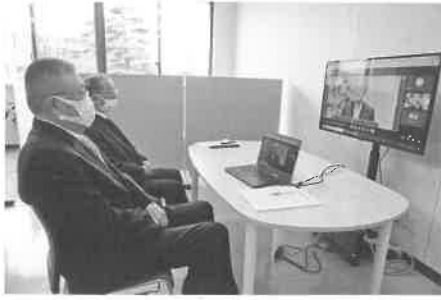
オンライン総会の様子

総会の冒頭にあいさつした三村会頭は、商工会議所の果たすべき役割として「中小企業の挑戦支援」事業再構築、取引適正化などを通じた付加価値の向上、「地域ぐるみの地方創生の推進」の3点を示し、総力を挙げて取り組む考えを表明しました。また、来賓挨拶では岸田文雄首相、萩生田光一経済産業大臣よりビデオメッセージで商工会議所に対する感謝の意が述べられました。