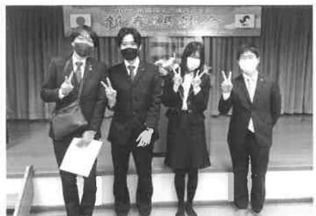
久しぶりの外部事業