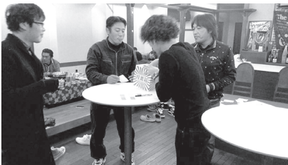
第一希望がぶつかり、運命のドラフトへ...