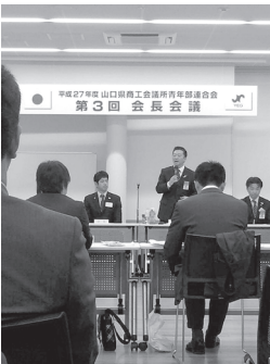
伴会長は今年度、全国の各道府県連を回られています。