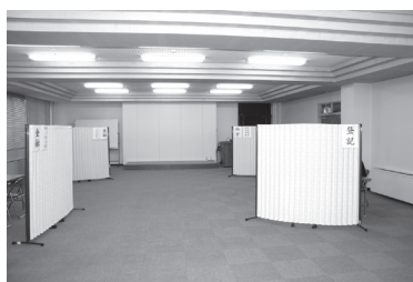
個人情報保護のため、中が見えないようにしています。

12月3日(木) 10時~15時、当所でもなんでも相談会が開催されました。 税務や金融、法律や登記、年金等、様々な専門家が一堂に会し、相談無料・個別相談・秘密厳守で、今年は延べ36名の方にご利用いただきました。相談したいこと、困っていることはあるけどわざわざ出向くのはちょっと・・・という方は、来年も開催を予定しておりますので、ぜひご利用ください。